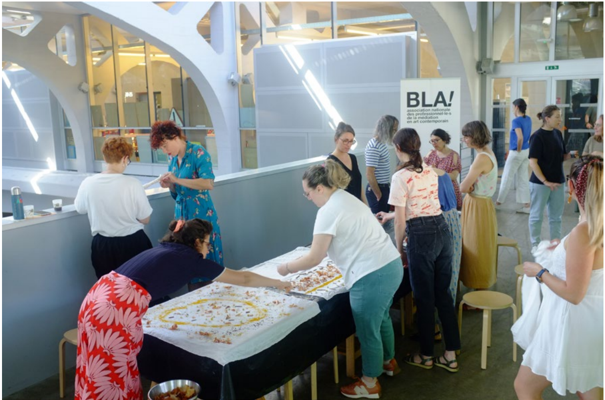
Réalisation des foulards sur soie avec la technique de l'éco-print à la Kunsthalle, Mulhouse, 8 juillet 2024