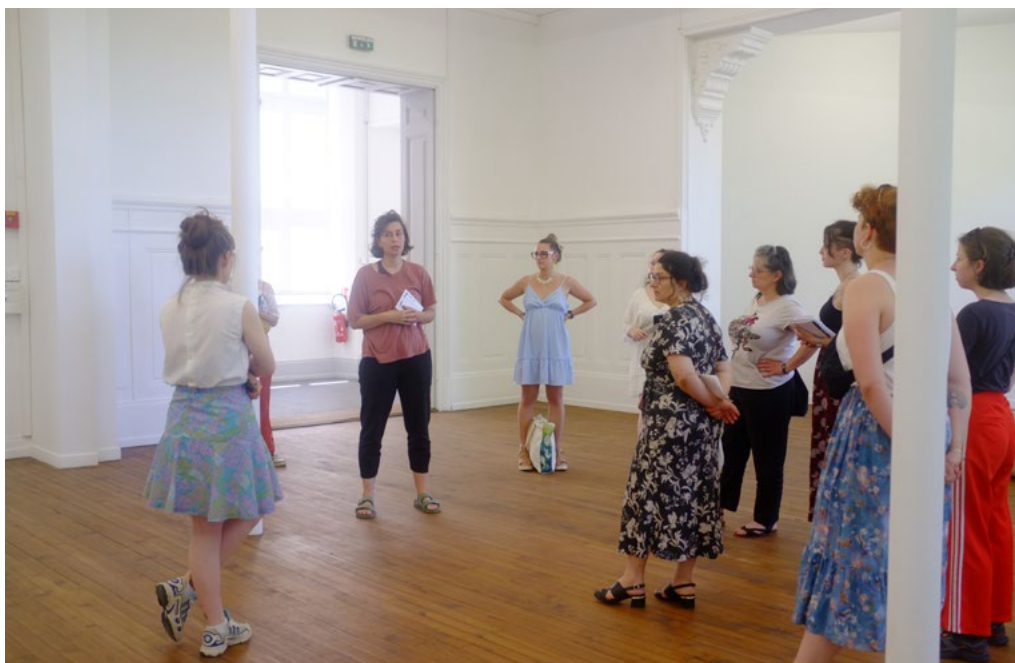
Visite de l'exposition Même mot par Sarah Menu, 9 juillet 2024

L'exposition Même mot de Julia Spínola est le point de départ de multiples expérimentations artistiques proposées lors du stage. Les inscrit-e-s ont découvert les activités et ateliers conçus par le CRAC Alsace autour de l'exposition.