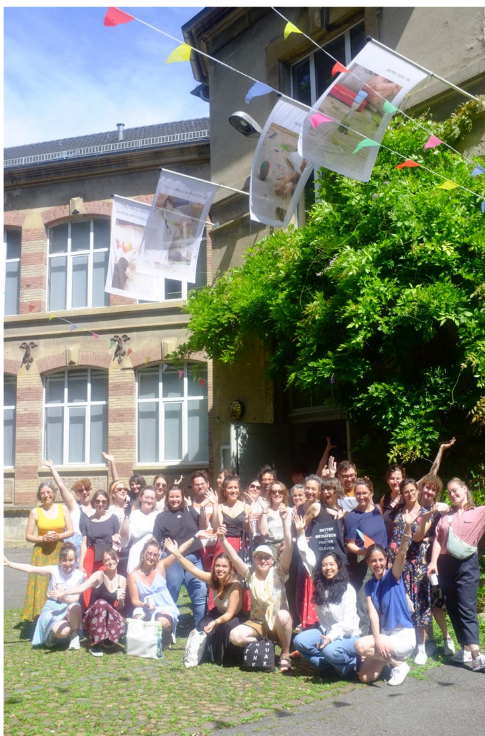
Photographie des inscrit-e-s devant le CRAC Alsace, Altkirch, 9 juillet 2024

Le tout dans le cadre d'une ambiance toujours très agréable ! »