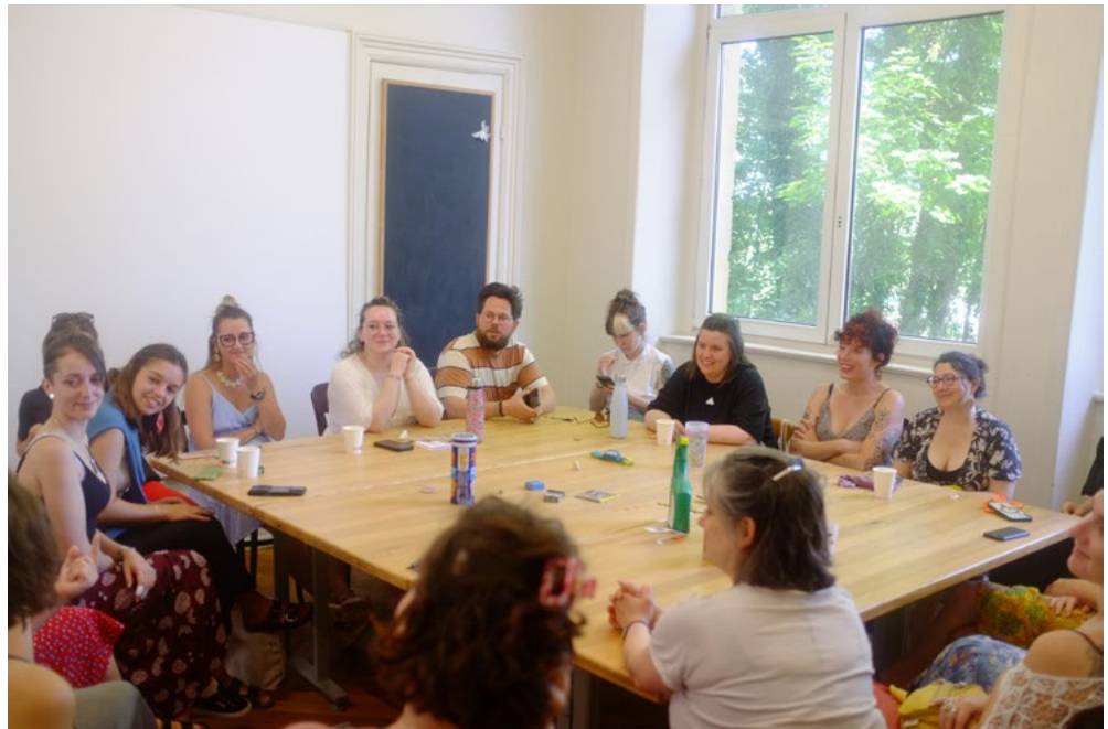
Vue de l'atelier « Matière à compostage », 9 juillet 2024, dans les ateliers aux CRAC Alsace

Comment ce phénomène physique « invisible » modèle-t-il notre conscience des lieux, notre relation au temps, à la mémoire et à la transformation matérielle du vivant ?