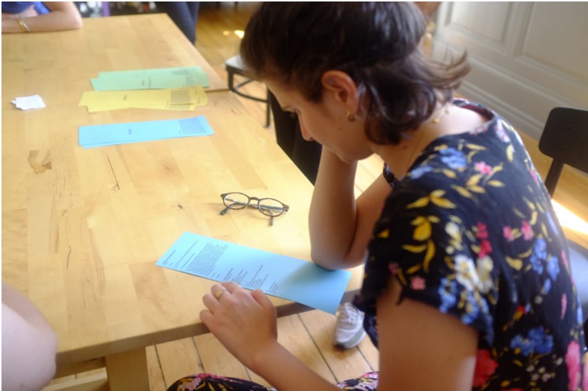
Réalisation des éditions grâce aux techniques alternatives d'impression, 9 juillet 2024, espace de résidence du CRAC Alsace