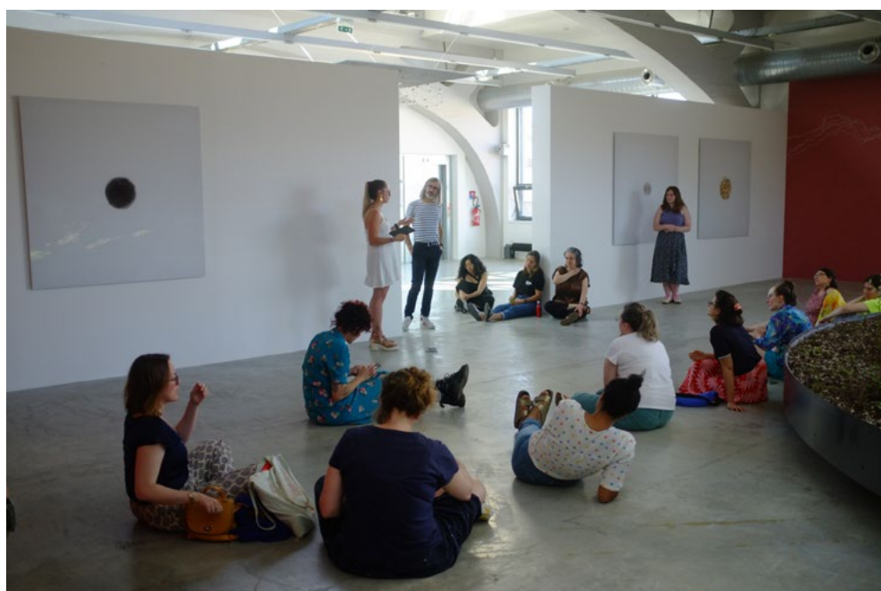
Visite de l'exposition Darra-Zahra, 8 juillet 2024

À noter : pour chaque exposition, des audioguides sont aussi réalisés par l'équipe de médiation.